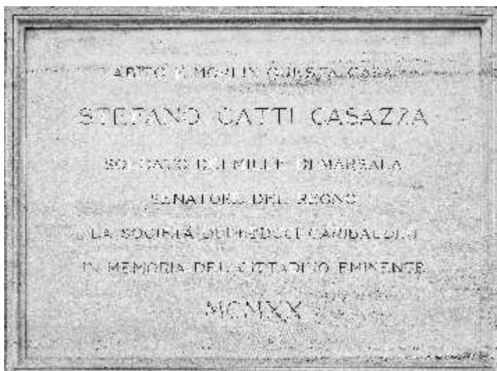
La targa in marmo di Corso Giovecca 157, palazzo di famiglia dei Gatti Casazza; il cognome richiamò l'attenzione di un drappello di soldati americani entrati a Ferrara nell'aprile 1945.