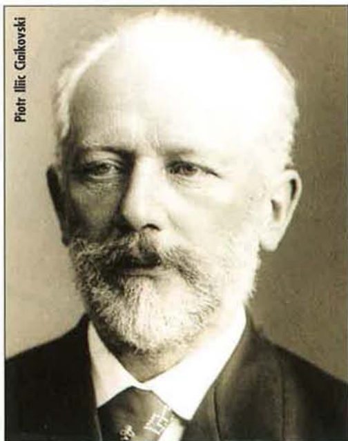
Piotr Il'ic Ciaikovski