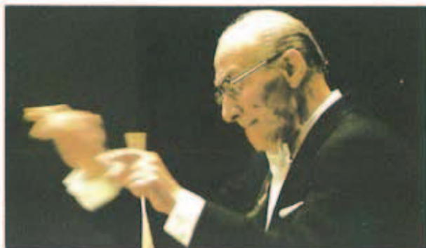
Pagina 52 Lo Zar Eugenio