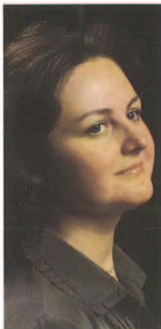
Pagina 30 L'arte della coloratura