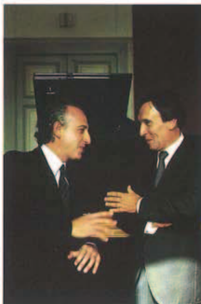
Pagina 34 Abbado & Pollini