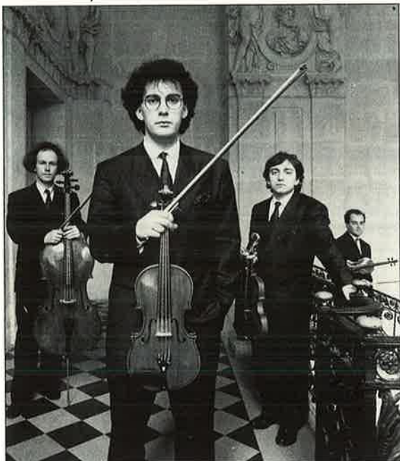
Wolfgang Amadeus Mozart